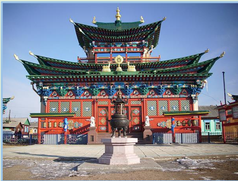
Храм-дворец хамбо-ламы Итигэлова в Иволгинском дацане